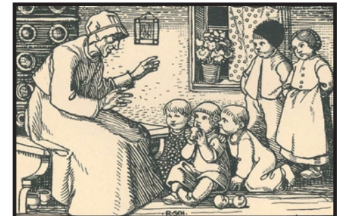
Spielmann, Nr. 36, S.7.

Zur Vermittlung von Texten in Vorschule und Schule